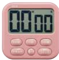
ダスティーピンク