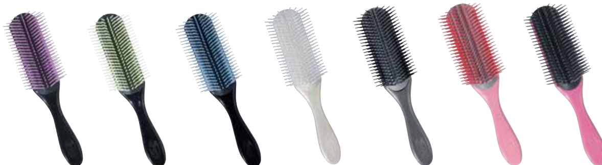
ブラック×パープル