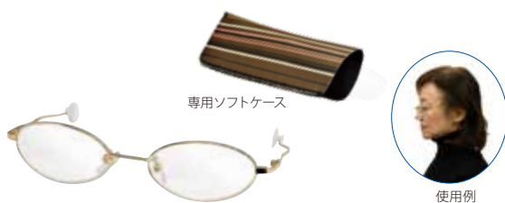
専用ソフトケース

お客様がパーマ・カラーの待ち時間に使用する老眼鏡 メガネのツルが通常の半分の長さでツルをこめかみで固定