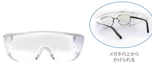
メガネの上からかけられる