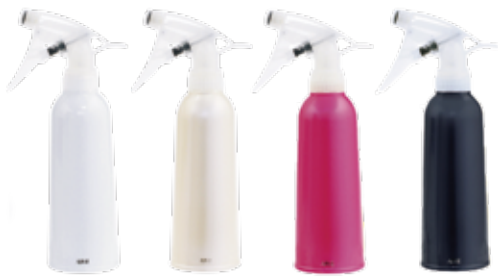
スケルトン ホワイト メタリック ホワイト メタリック ピンク ブラック

弾力性のあるエラストマー製の二重構造のカバーが外部の衝撃からボトルを守るプロ仕様のスプレーヤー