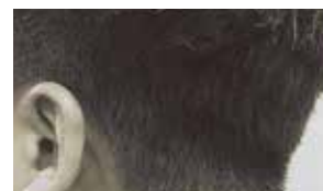
面が広い部分でパワフルな切れ味を再現 (髪の長さ 2cm 以上)