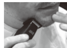
フェイスヘアの整えに