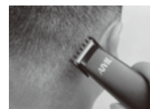
うなじ、ネーブなどヘアの整えに