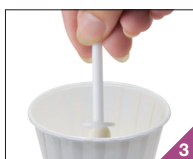
溶けたワックスを 専用スティックに巻き付けます。