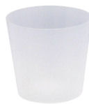
耐熱プラカップ × 1個

分量を量る必要もなく、使い切りタイプだから清潔です。 スティックとワックスはサロンと同じ商品を使用しています。