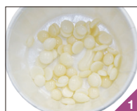
1袋分のワックスを 耐熱紙カップに入れます。