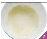
電子レンジで1分半～2分 温めてワックスを溶かします。