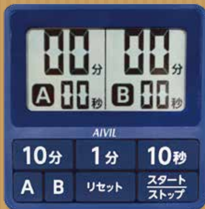
AIVIL 15秒 ダブルタイマー T-551

商品サイズ: 75x75x10mm 重量: 48g 最大セット時間: 199分50秒 カウントアップ最大計測時間: 180分00秒 動作温度範囲: 0~40℃ 防滴仕様: JIS C 0920 IPX2 使用電池: リチウム電池 CR2025x1個 電池寿命: 約1年間 付属品: ストラップ