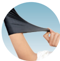
耐引張強度に優れた素材です