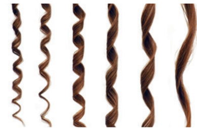
12mm 16mm 19mm 25mm 32mm 38mm