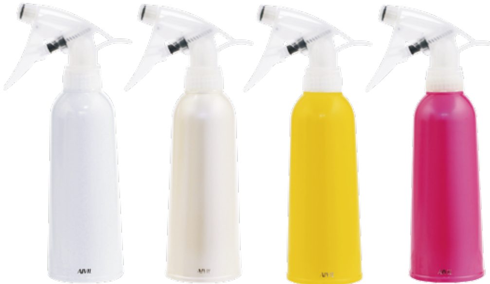
スケルトンホワイト