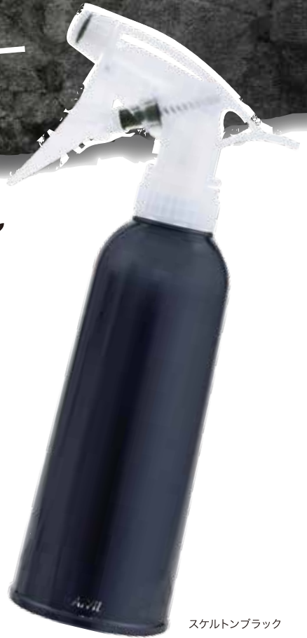
スケルトンブラック