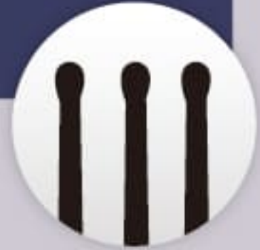
ナイロンピン 拡大図