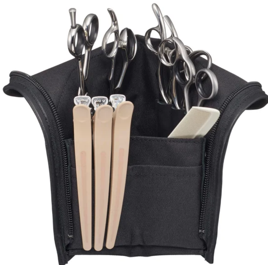
テーブルに立てて置くこともできるアイビルシザーポーチ