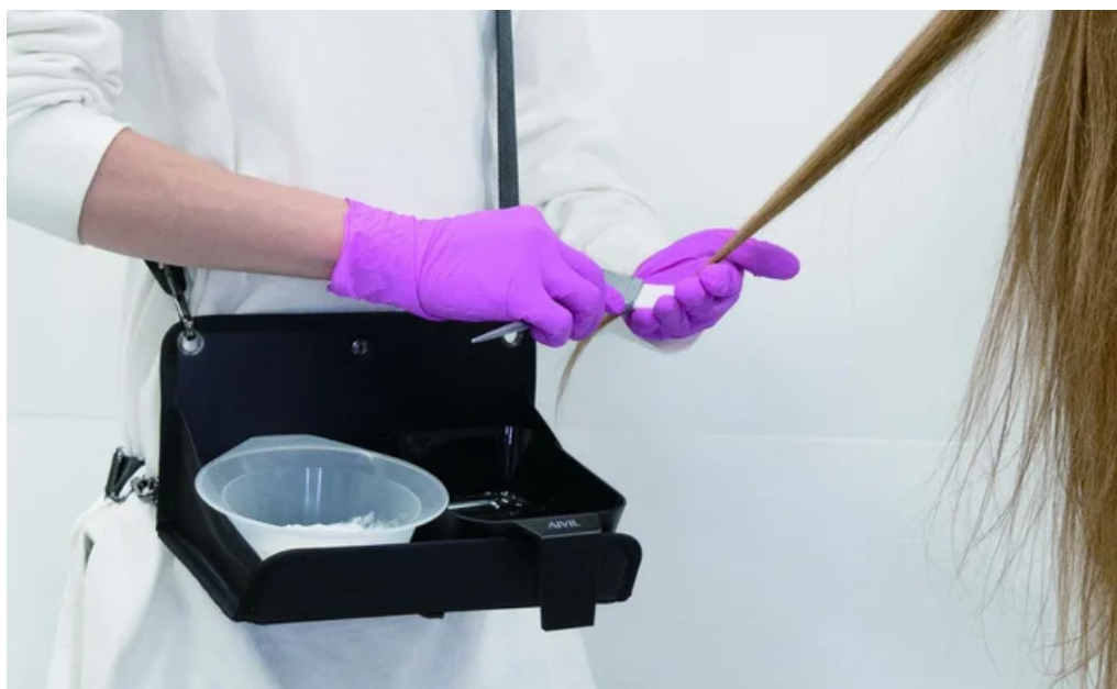
画板をヒントに生まれたアイビル マルチツールトレイ

「訪問美容の際、お客様の自宅にはワゴンがない。ワゴンの代わりに使うカラーカップの置き場所として、昔絵を描いていたときに使っていた画板のようなものがあると便利だと思い、考案した。」